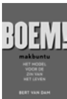
Boem! Bert van Dam € 16,50

onnozelen van geest zullen we maar zeggen. De 17,50 euro die het boek kost is wellicht uw best bestede investering ooit. Kopen én lezen. En over die aanbeveling van die vervelende Joris Luyendijk op de cover plakken we een stickertje. Tot slot, leuk voor uw vrouw en/of maîtresse: F*ck die onzekerheid van bedrijfskundige Vreneli Stadelmaier. Zij schreef een boekje over het impostor syndrome , de angst dat je een bepaalde functie in het bedrijfsleven niet aankunt. En dan vooral – of eigenlijk alleen – over vrouwen die aan dat syndroom lijden en wat zij eraan kunnen doen. Kunt u voortaan uw (onofficiële) eega wetschappelijk geruststellen. En anders gooit u het in de openhaard, terwijl u haar zachtjes streelt en zegt: 'Schatje, fuck die onzekerheid. Nog een glaasje wijn?'