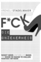
F*ck die onzekerheid Vreneli V. Stadelmaier € 17,95